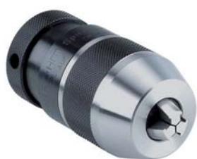
Mandrini autoserranti per l'industria

Affidabili e durevoli, grazie ad un design evoluto, siamo gli specialisti più affidabili per i lavori di precisione.